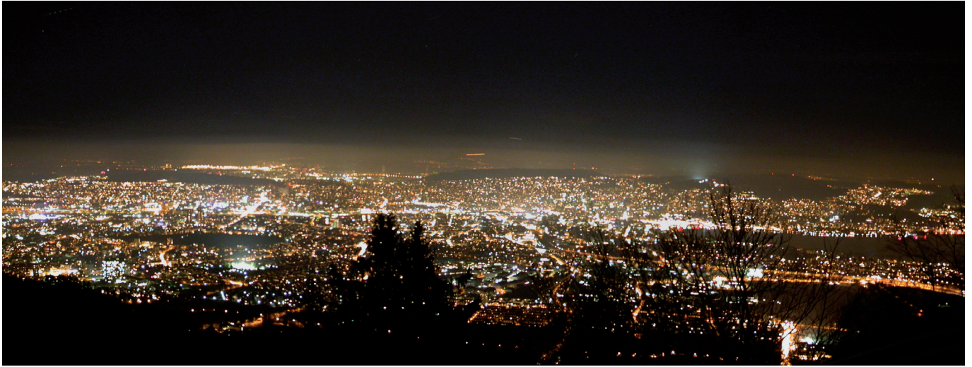
Stadt Zürich bei Nacht.